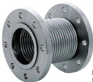
DN 15 - DN 500