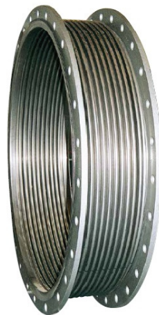
DN 600 - DN 2800